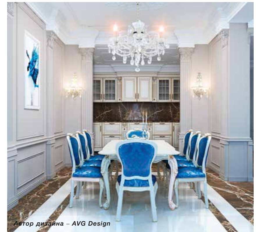
Автор дизайна – AVG Design