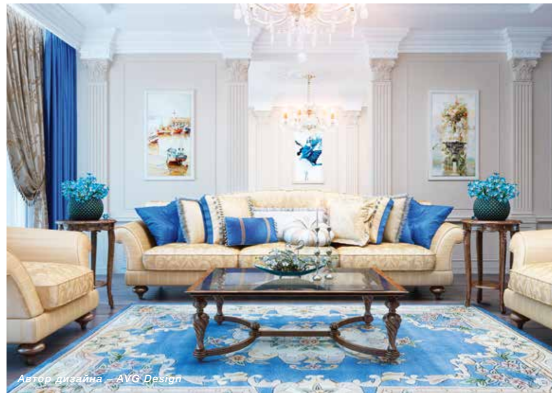
Автор дизайна – AVG Design