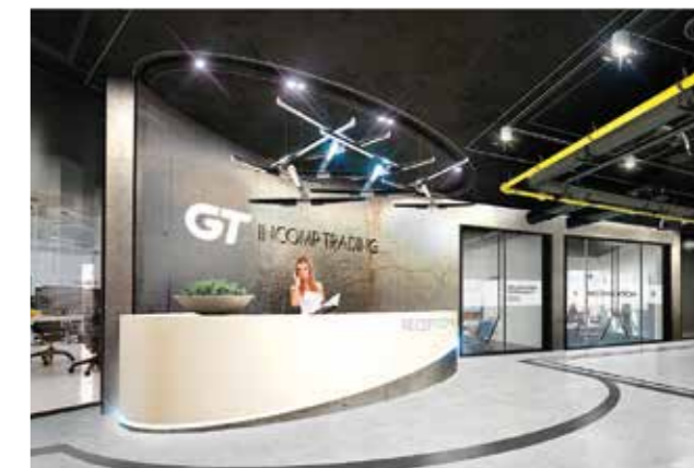
AVG разработала и сопровождает дизайн-проект интерьеров столичного офиса компании GT