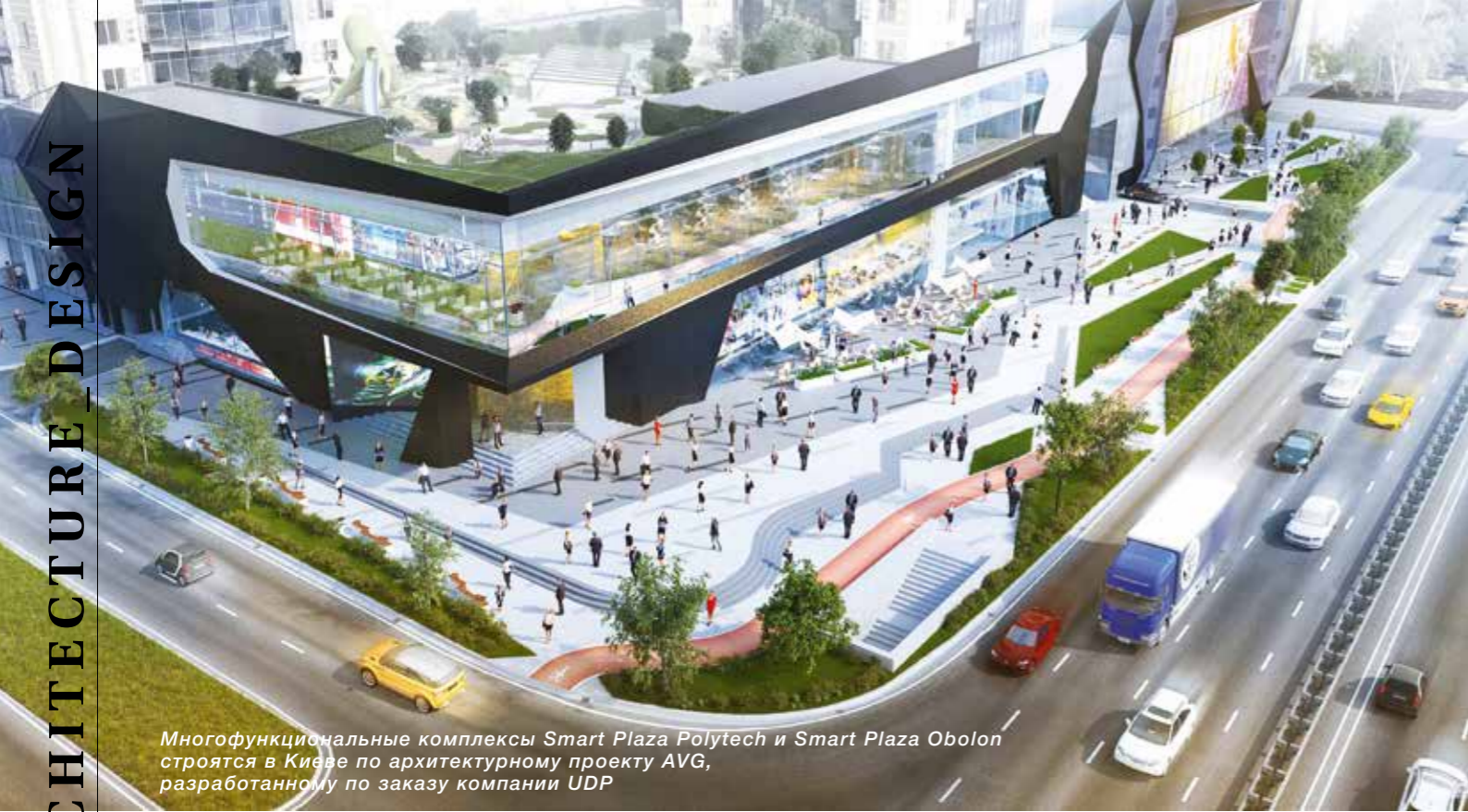
Многофункциональные комплексы Smart Plaza Polytech и Smart Plaza Obolon строятся в Киеве по архитектурному проекту AVG, разработанному по заказу компании UDP

этому в компании было создано подразделение строительного менеджмента. Собственноручное воплощение наших же разработок, как, например, в офисе компании «Фармак» или бизнес-центре «Леонардо», позволило добиться полного соответствия реализации визуализациям. Чего и ожидает владелец недвижимо-