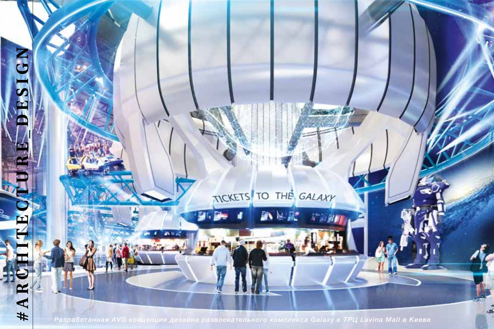
Разработанная AVG концепция дизайна развлекательного комплекса Galaxy в ТРЦ Lavina Mall в Киеве