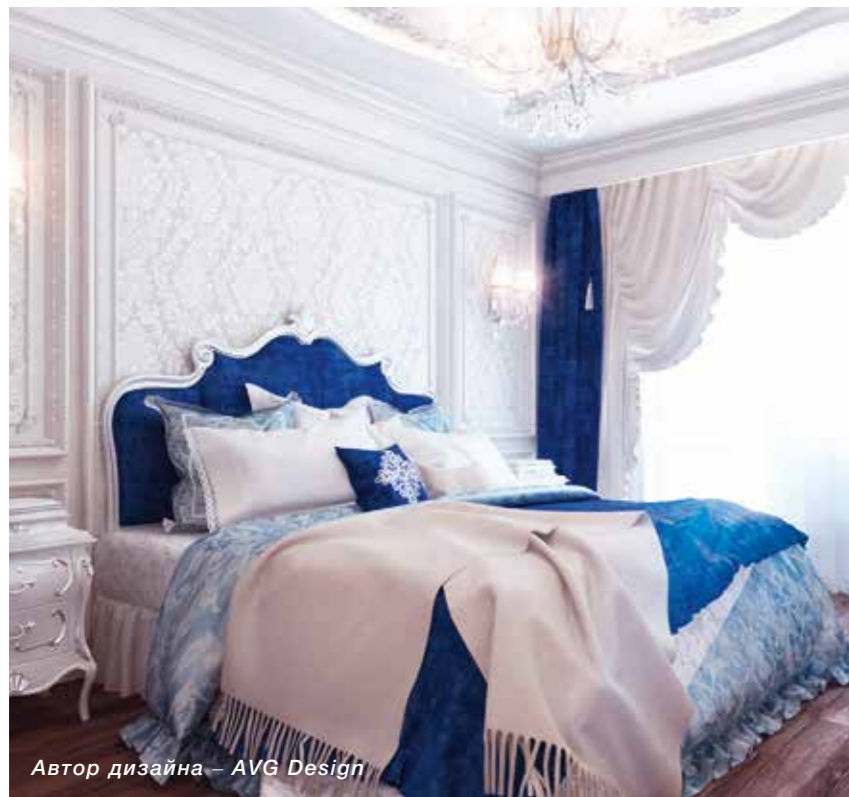
Автор дизайна – AVG Design