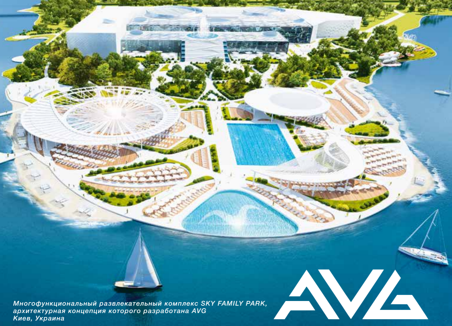
Многофункциональный развлекательный комплекс SKY FAMILY PARK, архитектурная концепция которого разработана AVG Киев, Украина