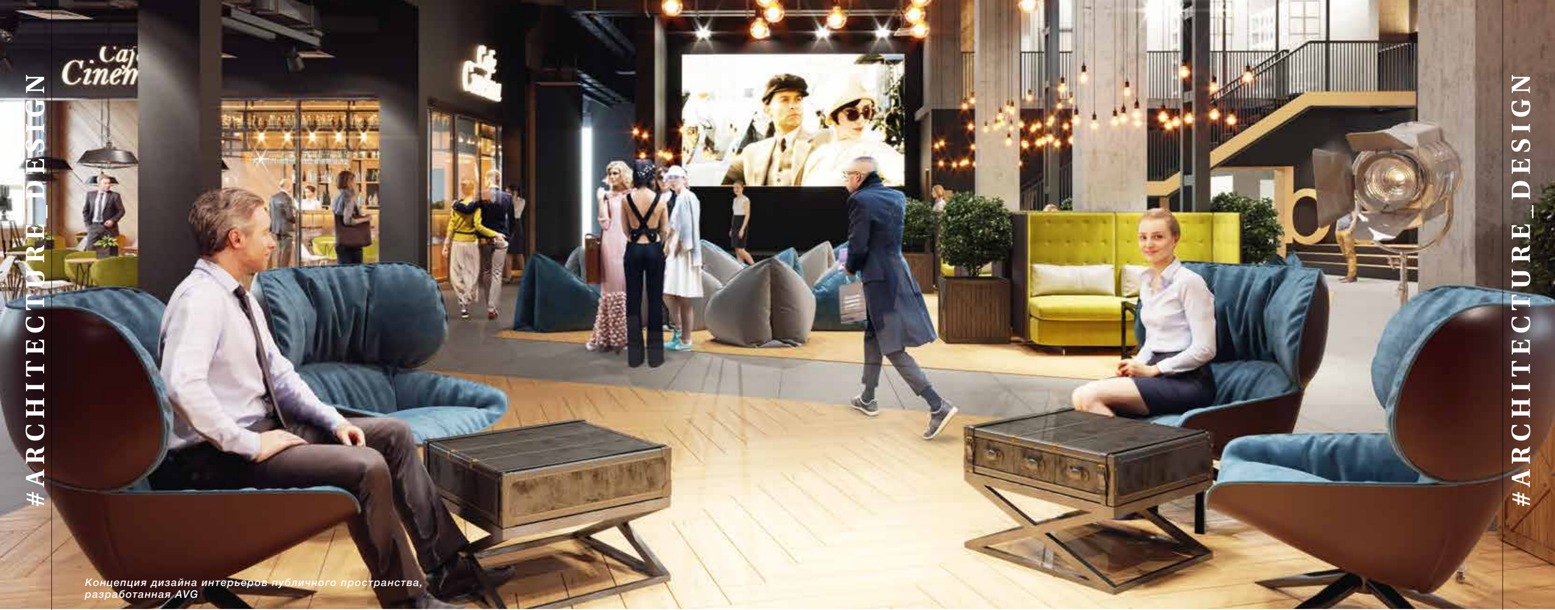
Концепция дизайна интерьеров публичного пространства, разработанная AVG